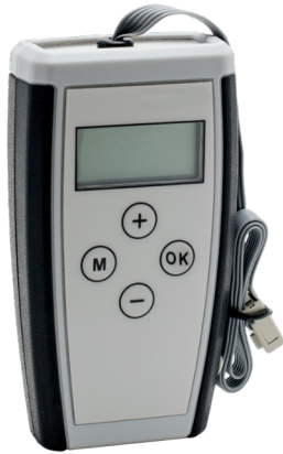
Outil de configuration HDK régulateur.